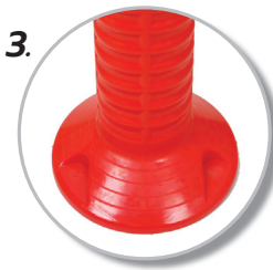
3. มีรูสำหรับฝังพุก 3 ตัว เพื่อยึดติดกับพื้นถนน