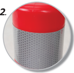
2. แถบขาวสะท้อนแสงสีขาว High Grade