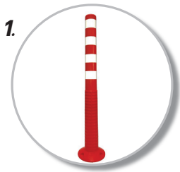
1. ผลิตจาก TPU มีคุณสมบัติเรื่องยืดหยุ่นและคืนตัวได้ดี