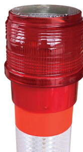
อุปกรณ์เสริมไฟกระพริบโซล่าเซลล์ ชนิดสวม