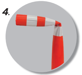
4. ทนทานต่อการชน การกระแทก และการกดทับ คืนตัวได้ดี