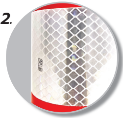
2. แถบขาวสะท้อนแสงสีขาว 3M™ Diamond Grade