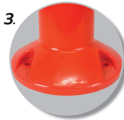
3. มีรูสำหรับฝังฟูก 3 ตัว เพื่อยึดติดกับพื้นถนน