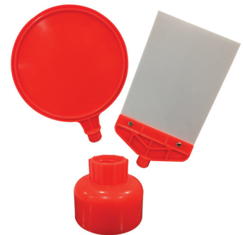
ป้ายครอบเสาเข็มลูก ชนิดสวม