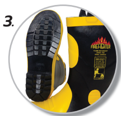
3. รองเท้าบูทหัวเหล็ก พื้นกันลื่น กันทะลุ