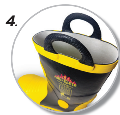
4. หูหิ้วรองเท้า พกพาใช้งานสะดวก