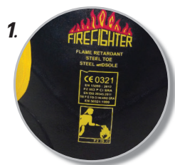
1. รองเท้าบูทยางดับเพลิง มาตรฐาน CE EN