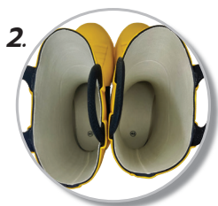
2. ฝ่าชั้นในทนไฟ