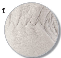
1. ทำจากหนังแพะ นุ่มและทนทานต่อการขีดข่วน