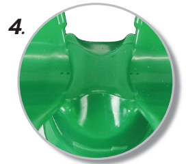
4. มีฉีดน้ำ 4 จุด ล้างตาพร้อมกันได้ทั้ง 2 ข้าง