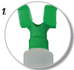
1. ขวดทำจากพลาสติก ปลอดสารพิษ