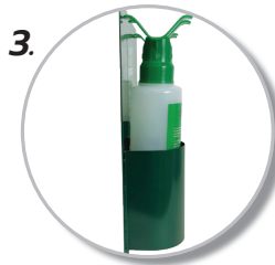
3. สำหรับติดตั้งกับผนัง ใส่ขวด 500 มล.ได้ 2 ขวด