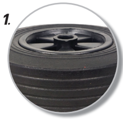
1. ผลิตจาก ยางเนื้อตัน แน่น มีน้ำหนัก