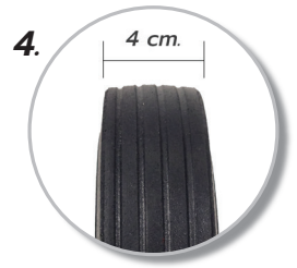
4. หน้าสัมผัสล้อกว้างกว่า 4 cm.