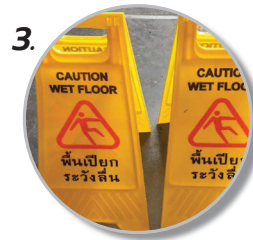
3. ติดสติ๊กเกอร์ ข้อความ ได้ตามที่ต้องการ