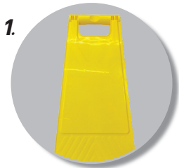
1. ป้ายตั้งพื้นทำจากพลาสติก PP คุณภาพดี แข็งแรง