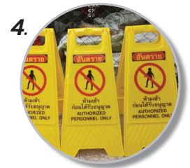
4. ใช้ได้ทั้งในร่มและกลางแจ้ง