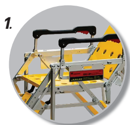
1. โครงรถทำด้วย อลูมิเนียมอัลลอย