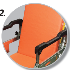
2. เบาะทำจากฟองน้ำหนานุ่ม หุ้มหนังเทียมกันน้ำ