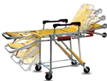
ปรบองสภาพนักพิง และพักขาได้