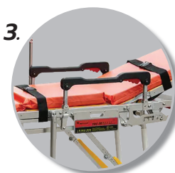
3. มีราวกันเตียง 2 ข้าง และเข็มขัดรัดตัวผู้ป่วย 2 เส้น