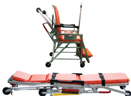
รูปแบบนอน-นั่ง