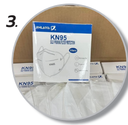
3. ปลอดภัยได้มาตรฐาน GB2626-2006