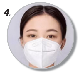
4. หน้ากากทรงแบบ 3D สวมใส่สบายกระชับตามมาตรฐาน