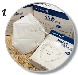
1. หน้ากาก KN95 กรองฝุ่น 0.3 ไมครอน 95%