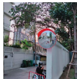
ทางเข้าออก