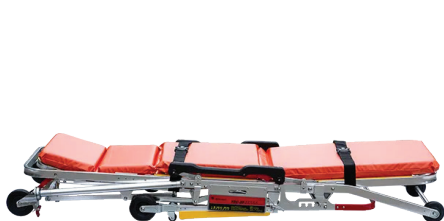
รูปแบบพับเก็บ