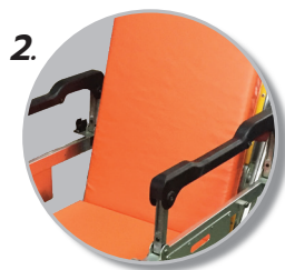
2. เบาะทำจากฟองน้ำหนานุ่ม หุ้มหนังเทียมกันน้ำ