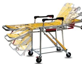
ปรับองศาพนักพิง และพักขาได้