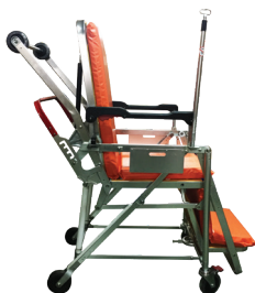
การใช้งานแบบเก้าอี้