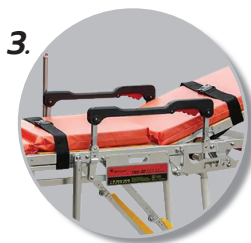
3. มีราวกันเตียง 2 ข้าง และเข็มขัดรัดตัวผู้ป่วย 2 เส้น