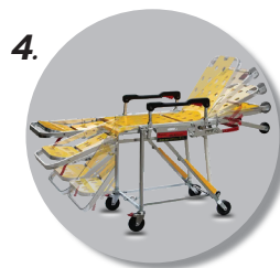
4. พนักพิงหลังและที่วางขาปรับได้ เพื่อความสะดวกสบาย